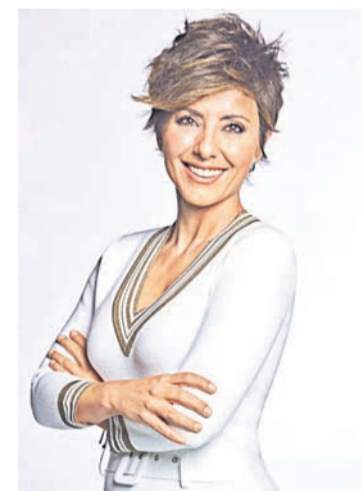
Sonsoles Ónega Periodista de Mediaset

Este año no nos vale con encomendarnos a la Virgencita (que me quede como estoy) porque volvemos con las ansias de inaugurar de verdad los felices años veinte, de cruzar fronteras sin el pasaporte de la enfermedad en la boca, de rozarnos en un concierto. Pero asumamos que el mundo ha cambiado y que quizá cuando salgamos a bailar no sepamos qué pie mover. El contagio masivo solo ha servido para una cosa: para que Pablo Casado dé positivo y Sánchez le desee en tres palabras "una pronta recuperación". Para que luego digan que no hablan. Por Twitter, claro. Volvemos.