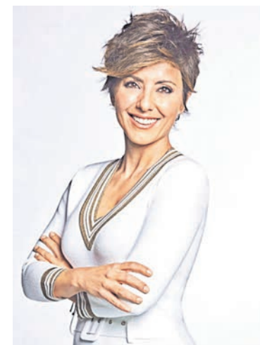
Sonsoles Ónega Periodista de Mediaset

Mientras tanto, van pasando cosas ahí fuera, en el mundo de los reales, que pasan inadvertidas porque las redes, aunque infinitas, no están para según qué asuntos. La luz no baja, sube la gasolina y arrecia el hambre. Supongo que los gabinetes de los políticos estallaron de emoción con la polémica del Benidorm Fest y encargaron a los séquitos de asesores papeles, iniciativas, ¡algo para entretenernos! Esta vez no han pedido dimisiones. Les ha valido con pedir comparecencias en el Congreso de los Diputados. Luego dicen.